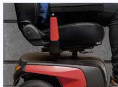
Columna de asiento reforzada