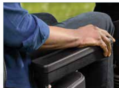
Reposabrazos ajustable en alto y ancho